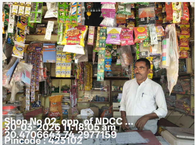
Photo of Stock