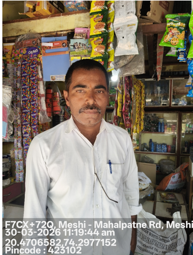
Photo with Agent