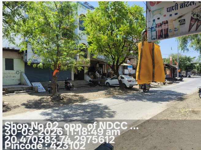
Photo of Outside Shop