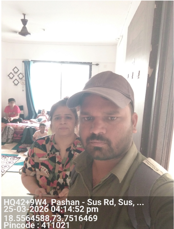
Photo with Agent