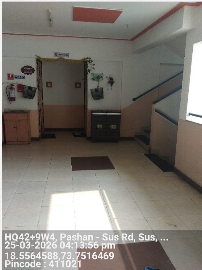
Photo of Outside Shop

HQ42+9W4, Pashan - Sus Rd, Sus, ... 25-03-2026 04:13:56 pm 18.5564588,73.7516469 Pincode : 411021