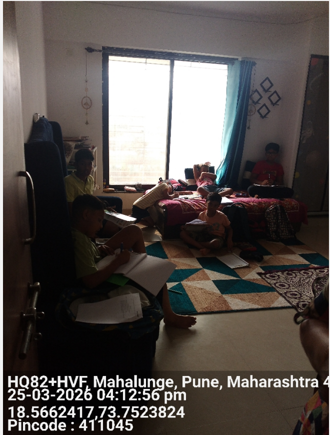
Photo of Stock